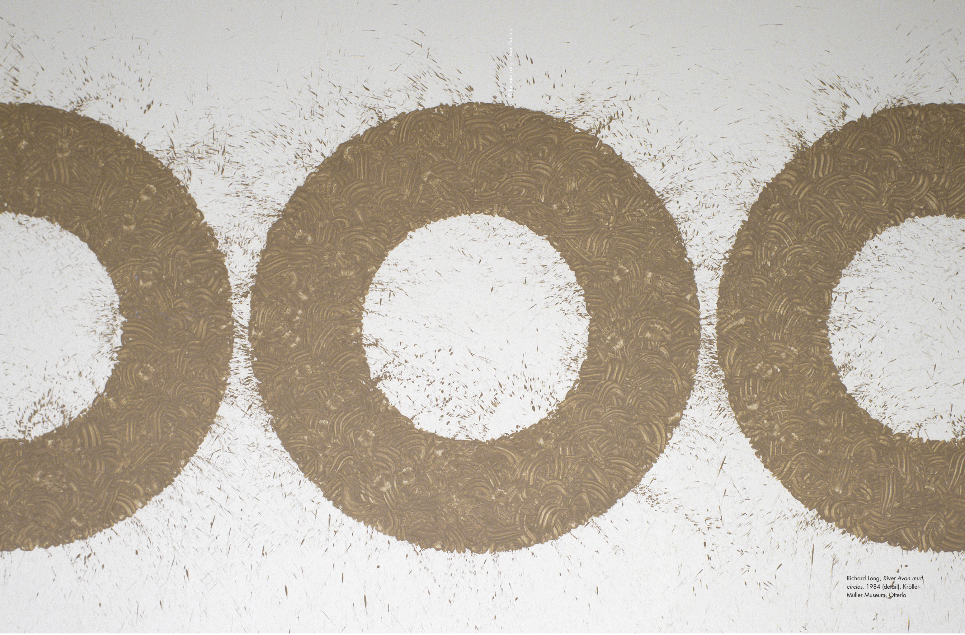
Richard Long, River Avon mud circles , 1984 (detail), Kröller-Müller Museum, Otterlo